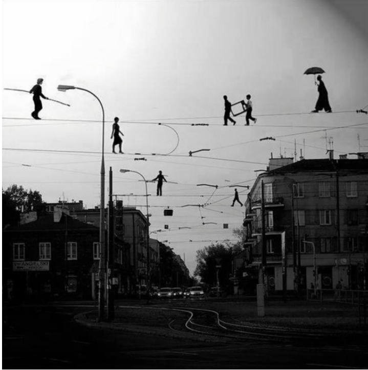
Categoría II (3º y 4º ESO)